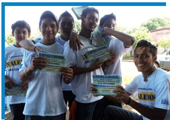
Jóvenes participando en la promoción del voto elecciones 2011.

Durante las elecciones nacionales de noviembre del 2011, repartió volantes en todo el barrio promoviendo “unas elecciones en paz”.